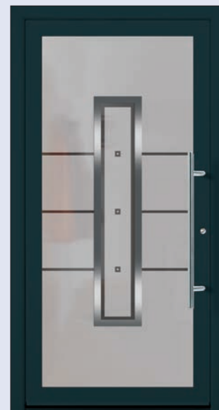
VIGRO 02 U d -Wert 1,20 1) Farbe Anthrazitgrau Extras Alunox Mindestmaß= 700 x 1.900 mm