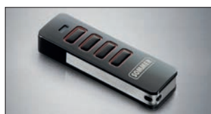
Pearl 4-Befehl Handsender