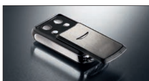
Slider 4-Befehl Handsender