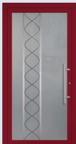
VIGRO 31 U d -Wert 1,20 *) Farbe Weinrot Extras Alunox Mindestmaß= 700 x 1.900 mm