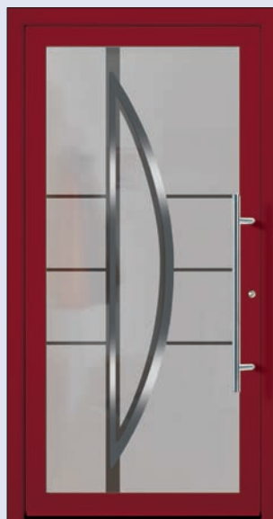
VIGRO 03 U d -Wert 1,20 1) Farbe Weinrot Extras Alunox Mindestmaß= 700 x 1.900 mm