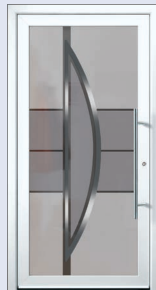
VIGRO 04 U d -Wert 1,20 1) Farbe Verkehrsweiss Extras Alunox Mindestmaß= 700 x 1.900 mm